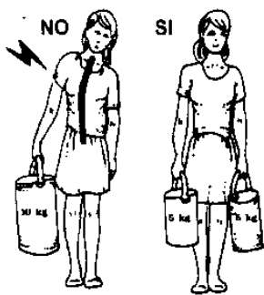
BILANCIARE SEMPRE I CARICHI